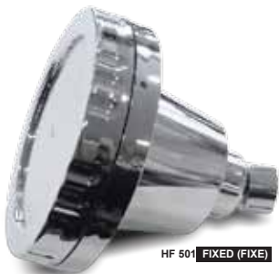
HF 501 FIXED (FIXE)